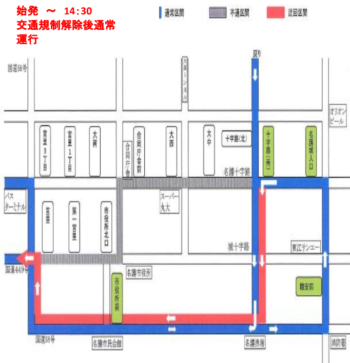
ツールド沖縄迂回路図 (65番)